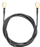
1x Kabel zemní 150 cm