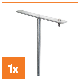
Síť 20 tyčí | 65 cm | 50 m